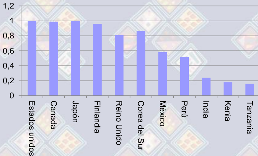
Factores de producción por trabajador en relación con los Estados Unidos